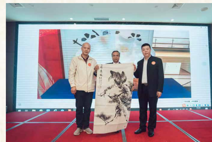
深莞校友会赠送国画作品