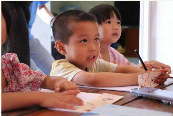
认真听课的孩子们

如果说人生有梦，那么今天大山深处的一株幼苗，或许明天就将长成山外的一颗参天大树。而本次“三下乡”暑期实践团能做的，就是播撒下理想的种子，使其