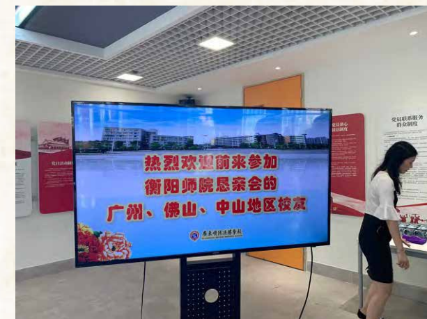
2020年6月28日， 校友会代表参观广东顺德德胜学校