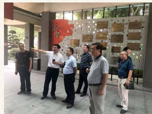
参观顺德德胜学校