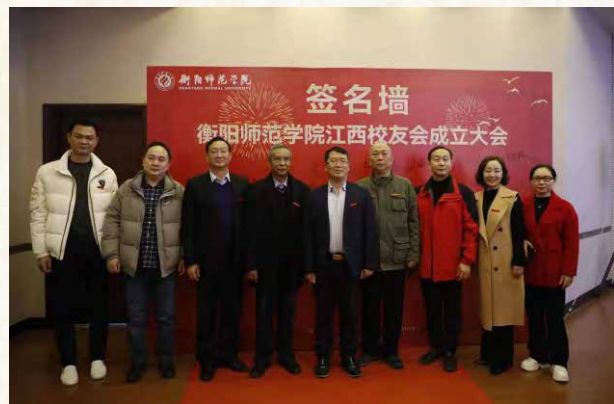
广佛中珠校友会代表团前往祝贺