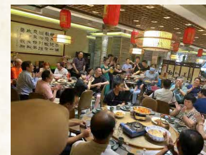
全体校友代表合唱湖南民歌《浏阳河》