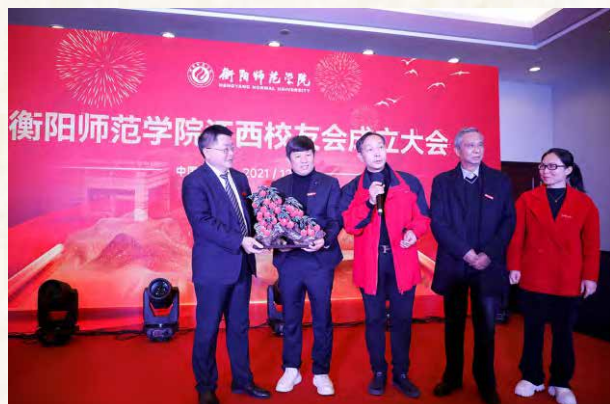
广佛中珠校友会赠送礼品