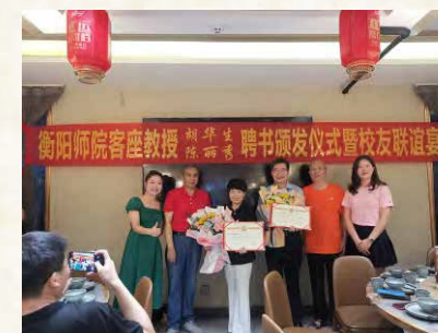
客座教授聘书颁发仪式