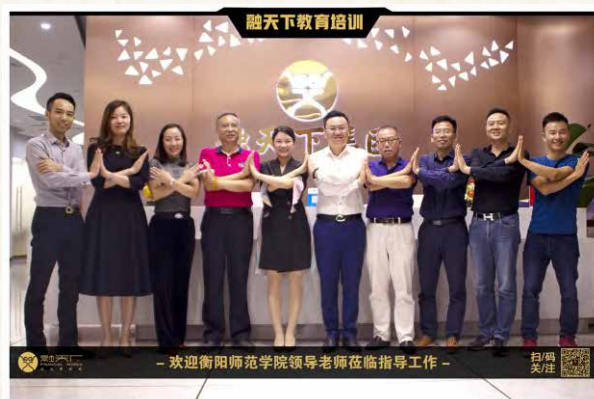
2019年10月18日， 校友会代表参观融天下集团