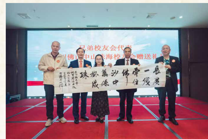
长沙校友会赠送条幅