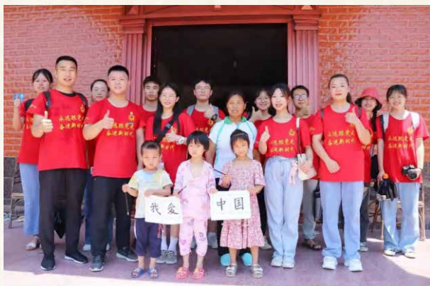
向着苍穹发起生命的进军