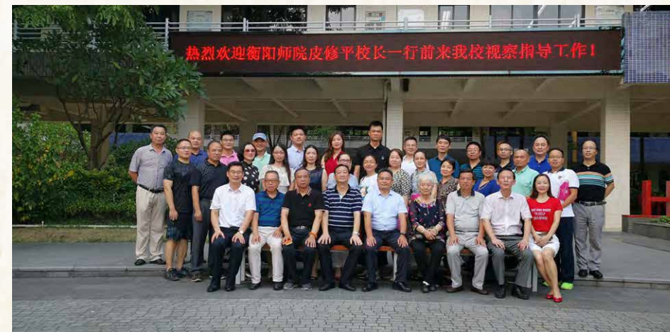
校领导在德胜学校与广佛中珠校友代表合影