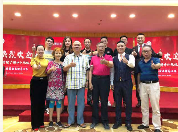
2019年10月19日， 校友会代表参观富企来公司