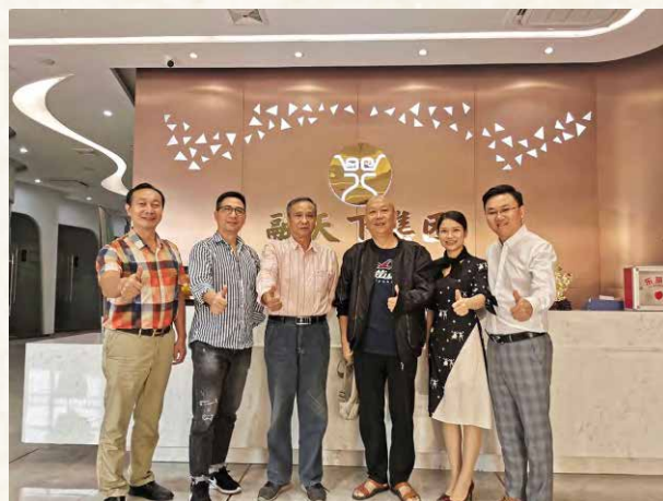
2019年10月26日，参观融天下集团