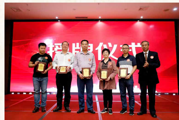
符会长给监事会成员授牌