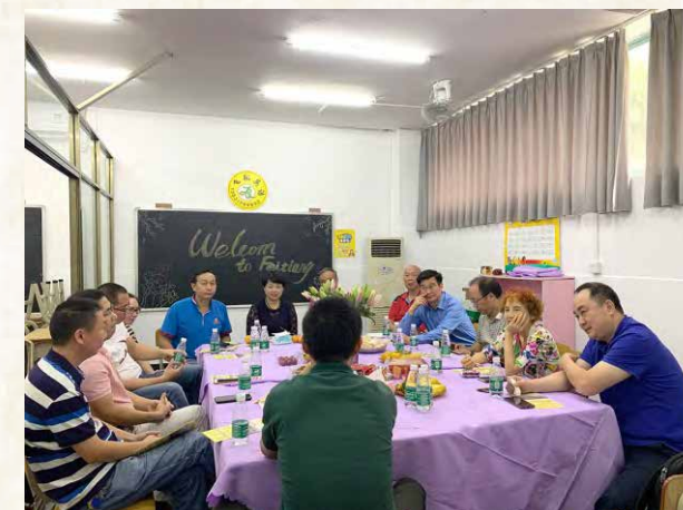
2019年10月31日， 校友会代表参观飞翔英语培训机构