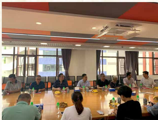
校领导与校友座谈