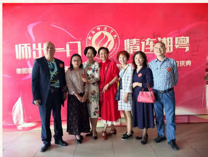
恢复高考后的 前三届部分参会代表