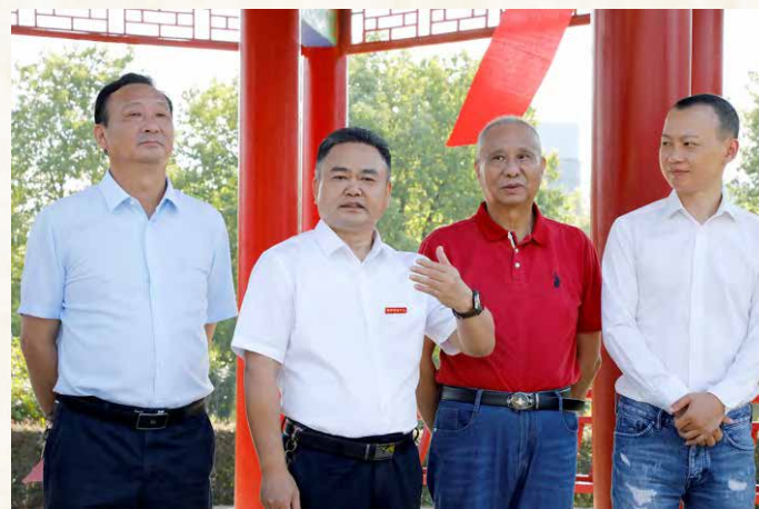
皮校长、刘书记、符会长、刘副会长参加青山亭落成庆典