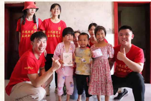
写好中国字，说好中国话