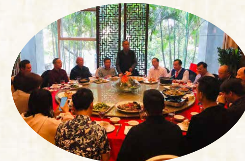
邹会长在九食八号客家菜馆举行欢迎晚宴