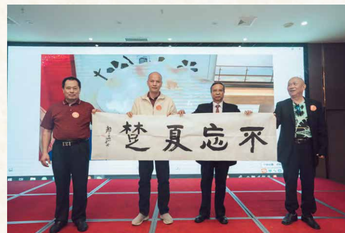
海南校友会赠送条幅