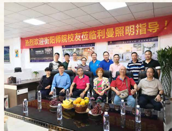
2019年10月28日， 校友会代表参观利曼照明公司