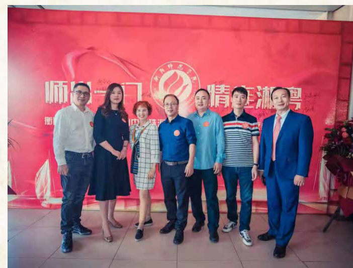
部分筹备组人员合影