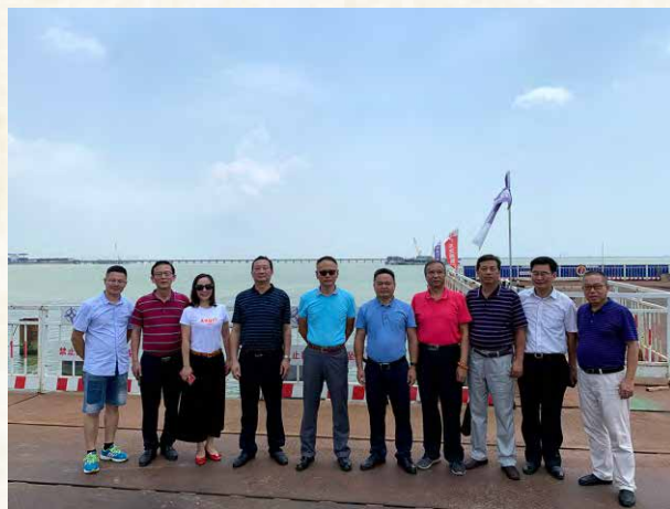
在深中大桥工地留影