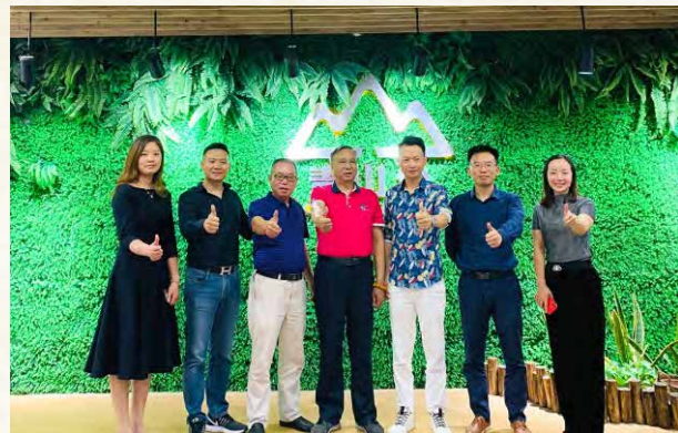
2019年10月18日， 校友会代表参观广州市青山公司