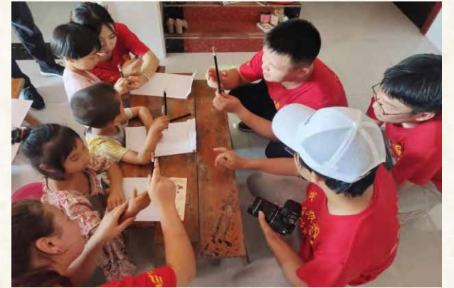
小朋友们学习如何握笔

希望神山村的孩子们能够像树一样成长，向着苍穹发起生命的进军，伸展开茂盛的枝叶迎接每个黎明与黄昏。