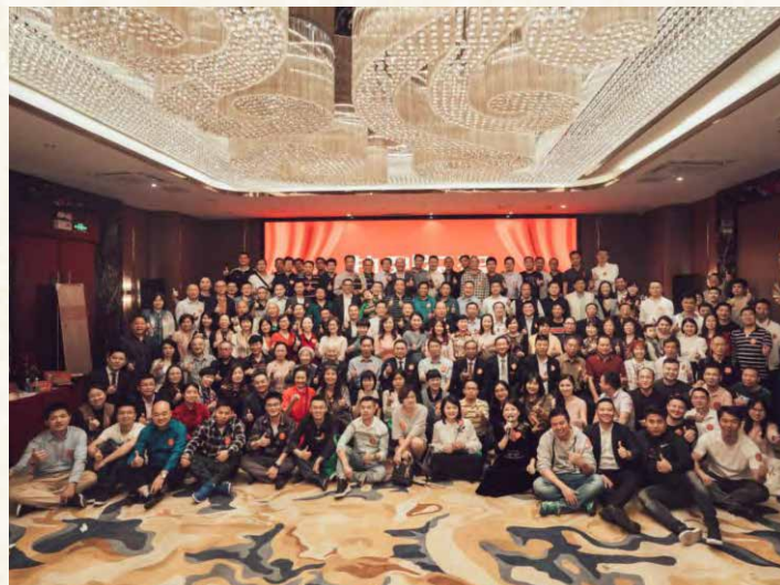
全体参会代表合影