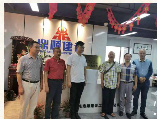
2020年4月18日， 校友会代表参观佛山鼎顺建设公司