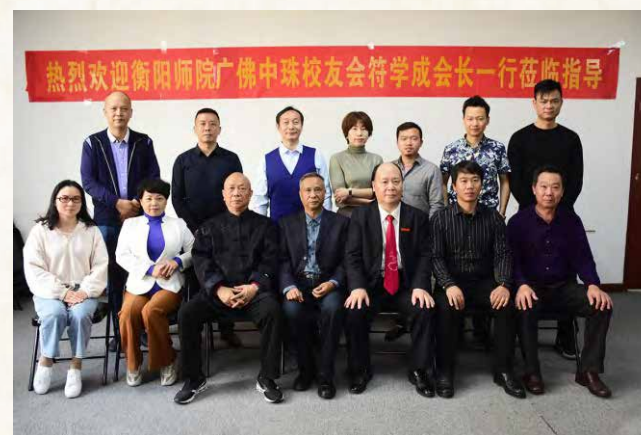
参观瑞华科技公司