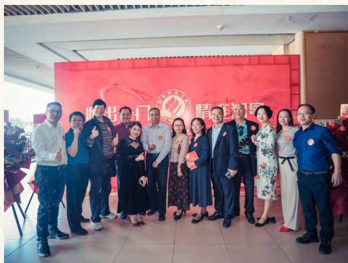
衡阳师院文学院部分参会代表