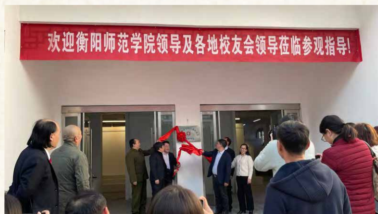
江西校友会婺源联络处揭牌

婺源实在美，校友心扉醉。 篁村山中屹，徽派民宅巍； 悬房识力学，怪屋吓死鬼。 洞房糯米甜，晒秋激情汇。 瀑布腾仙雾，古樟叠翠垒。 水口枫叶红，岭上奇石瑰。 梯田接天宇，天街人荟萃。 李坑溪水清，小桥绕涧飞， 门市满村落，民俗风雅随。 杏子果条脆，粉皮甲鱼肥。 蔬果飘清香，佳酿百金惠。 水墨上河宿，赤情胸中播。 放歌良宵夜，壮哉校友会！